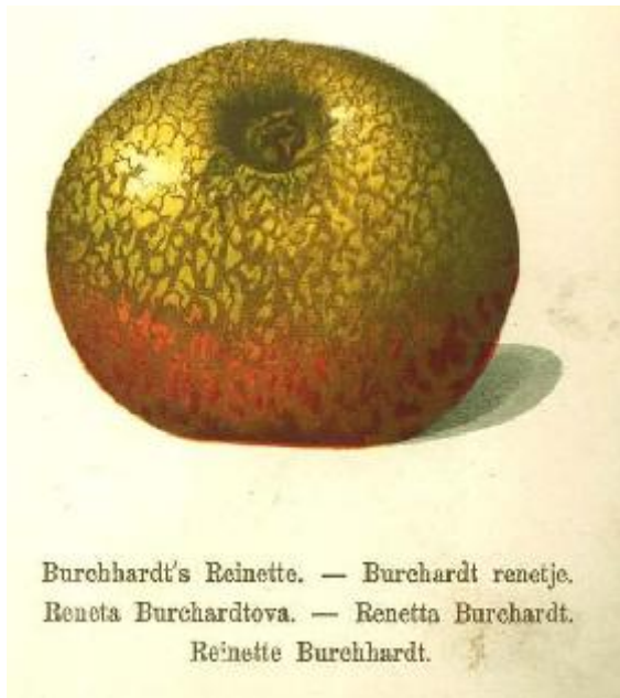
Stoll 1888, Pomologie.

ORIGINE : Obtenue de semis en Russie, à Nikita, par Von Hartwiss, directeur des jardins impériaux qui la dédia au pomologue allemand Burchardt (« Illustriertes Handbuch der Obstkunde », t.1, p.459, n°213 , Oberdieck, 1859). Présente chez A.Leroy d'Angers, depuis 1860 et encore en 1916. Elle est signalée à Brogdale « The Book of Apples », 1993, p.251. Dans les années 1930 elle était cultivée chez Nomblot à Bourg la Reine.